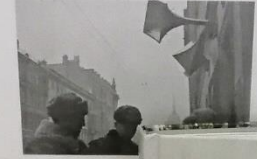
Зачинение трансляции метрономом. 1. Психологическое. Работников радио оза...

Люди в Ленинграде были отрезаны от страны. Не хватало продовольствия, ситуация была критической и поводов для опасений было предостаточно. Советская власть была верная сплоченная тяжелой ледяной блокадой в городе. В первые месяцы блокады на улицах города было установлено более 1 500 громкоговорителей. Почти 450 тысяч радиоточек было установлено в квартирах и учреждениях.